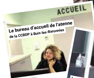
Le bureau d'accueil de l'antenne de la CCBDP à Buis-les-Baronnies