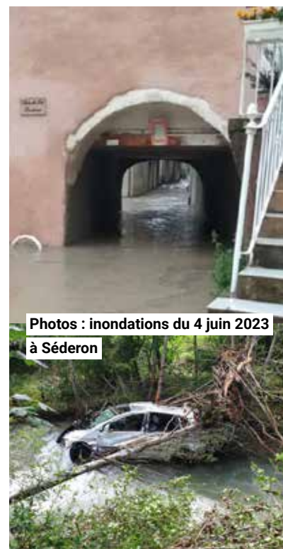
Photos : inondations du 4 juin 2023 à Séderon

En mutualisant les moyens, les informations et les procédures, le PICS permettra d'améliorer la protection des populations et la continuité des services. La CCBDP jouera un rôle de facilitateur au service des communes, afin de construire une réponse collective, cohérente et adaptée aux réalités du territoire.