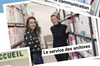
Le service des archives