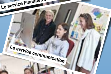
Le service communication