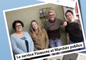
Le service Finances et Marchés publics