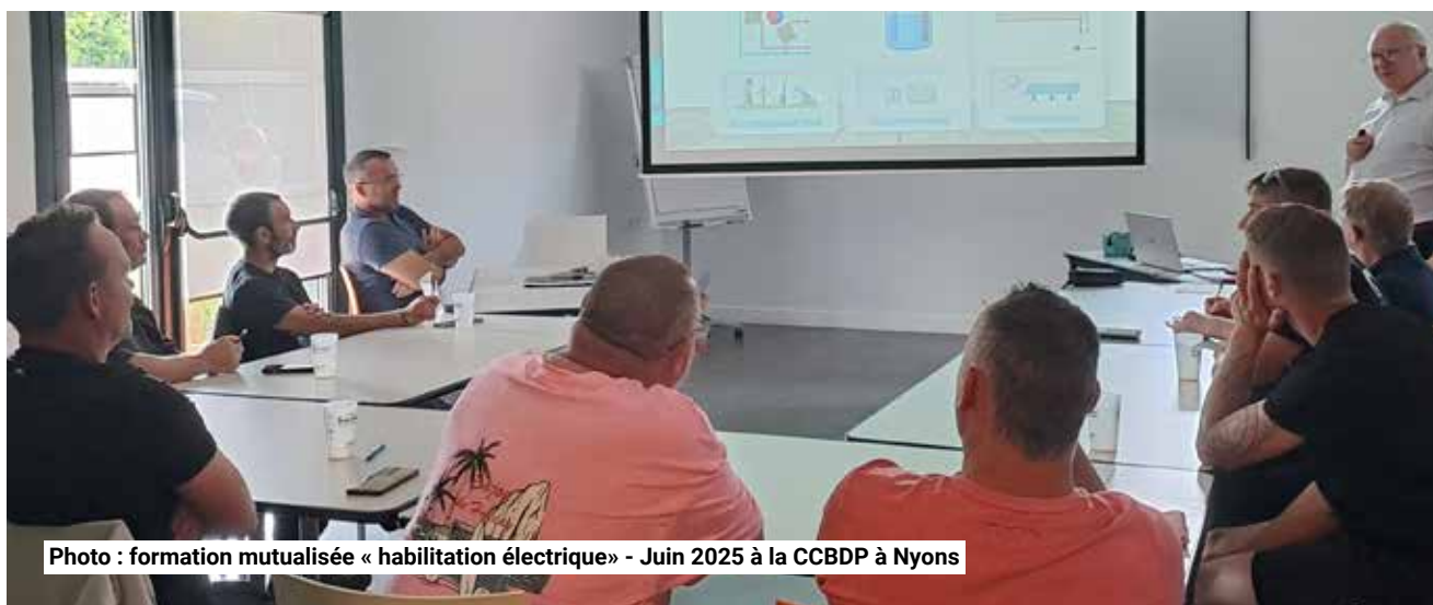
Photo : formation mutualisée « habilitation électrique » - Juin 2025 à la CCBDP à Nyons

NM : L'avenir du bloc communal, fondé sur le couple commune/communauté de communes, dépendra de la qualité du lien qui les unit. Cette solidarité, respectueuse des prérogatives de chacun, doit permettre d'avancer ensemble. La politique de mutualisation a vocation à perdurer et à se renforcer selon les besoins exprimés. La CCBDP restera facilitatrice, dans la limite des moyens confiés par les Maires.