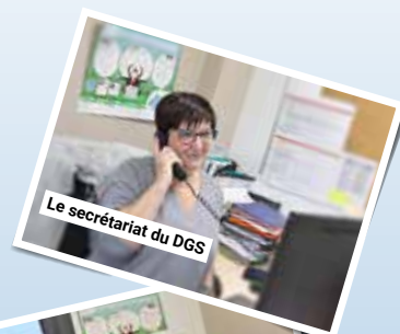
Le secrétariat du DGS