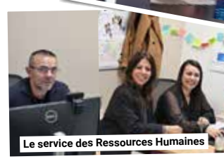
Le service des Ressources Humaines

Les services supports assurent la qualité et l'efficacité de l'action intercommunale portée par les élus et mise en œuvre par l'ensemble des services.