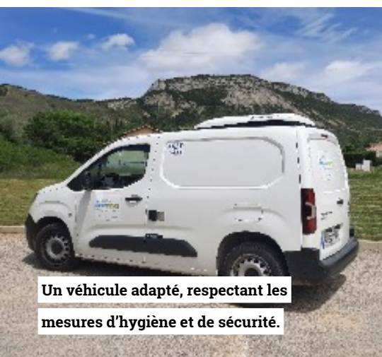
Un véhicule adapté, respectant les mesures d'hygiène et de sécurité.

Depuis 2017, la Communauté de communes propose un service de portage de repas à domicile pour les personnes âgées, résidant sur le territoire des Hautes Baronnies*, afin de favoriser leur maintien à domicile.