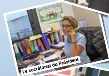
Le secrétariat du Président