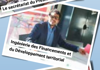
Ingénierie des Financements et du Développement territorial