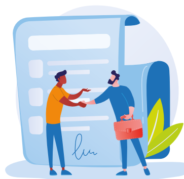
La signature d'un accord entre la CAF et un groupement de communes