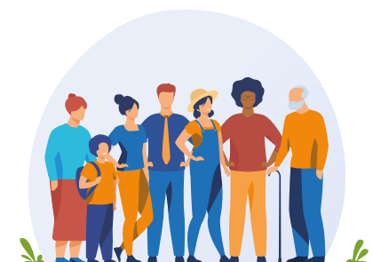
Des actions en direction des habitants

Outil expérimenté en 2009, elle est généralisée début 2014, sur l'ensemble du territoire national.