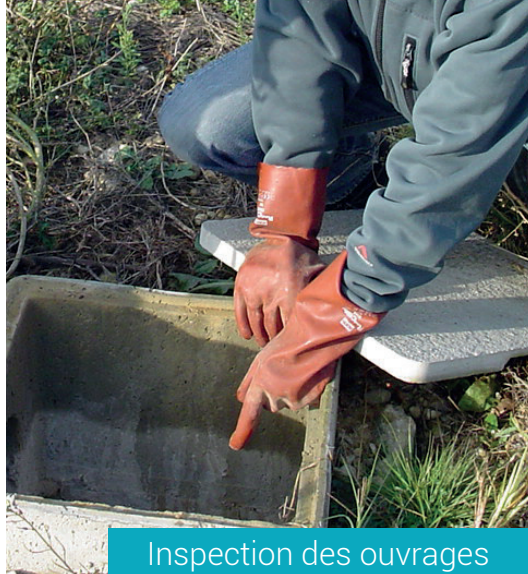
Inspection des ouvrages

Sur site, l'agent du SPANC vérifie les points à contrôler mentionnés dans l'article 11.1 du présent règlement de service. En amont du contrôle, il est demandé au propriétaire dans l'avis de passage de préparer et remettre au SPANC, tout élément permettant de vérifier l'existence de l'installation d'assainissement et son entretien (dégagement des regards de visite, factures des travaux ou justificatifs permettant de déterminer les volumes des ouvrages, photos, plans, étude de faisabilité, factures de vidange...).