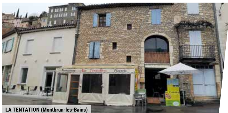
LA TENTATION (Montbrun-les-Bains)