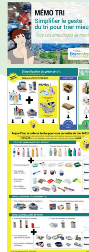
NOUVELLE SIGNALÉTIQUE SUR LES BACS DE TRI

Une application pour vous aider à trier : www.consignesdetri.fr